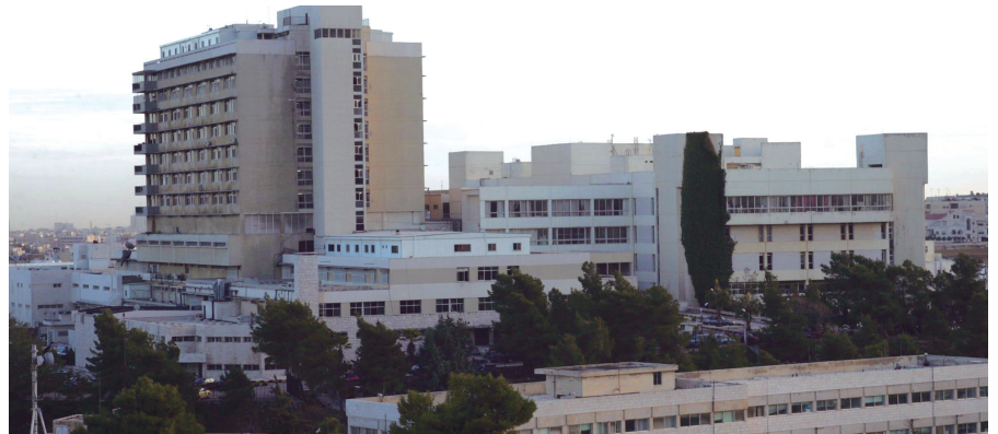
مبنى مستشفى الجامعة الأردنية

الأمراض الجلدية المختلفة، كما أن هذا البورد يؤهل حامله للعمل في مجال أجهزة الليزر بمهنية عالية وتخصصية متفردة وبما يتناسب ويتفق مع شروط السلامة الواجب توفرها عند مستخدمي هذه الأجهزة، خاصة في ظل انتشار استعمال هذه الأجهزة الطبية من قبل غير الأطباء وغير المختصين في هذا المجال.