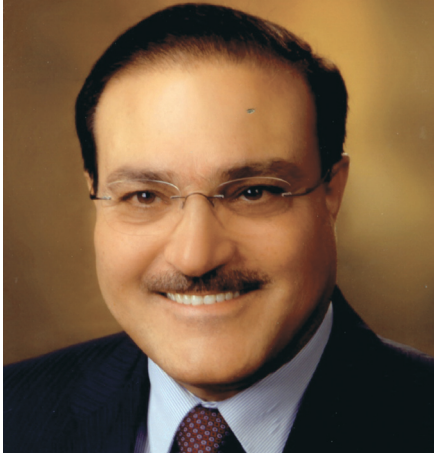
أ.د. عادل الطويسي

الجامعة - صدرت الإرادة الملكية السامية بتعيين الدكتور عادل الطويسي رئيساً للجامعة الأردنية. وكان مجلس التعليم العالي نَسَب في جلسته التي عقدها في الخامس عشر من أيلول بتعيين الدكتور عادل الطويسي رئيساً للجامعة الأردنية والدكتورة رويدا المعاينة رئيسة للجامعة الهاشمية والدكتور اخليف الطراونة رئيساً للجامعة البلقاء التطبيقية. التتمة... ص٧