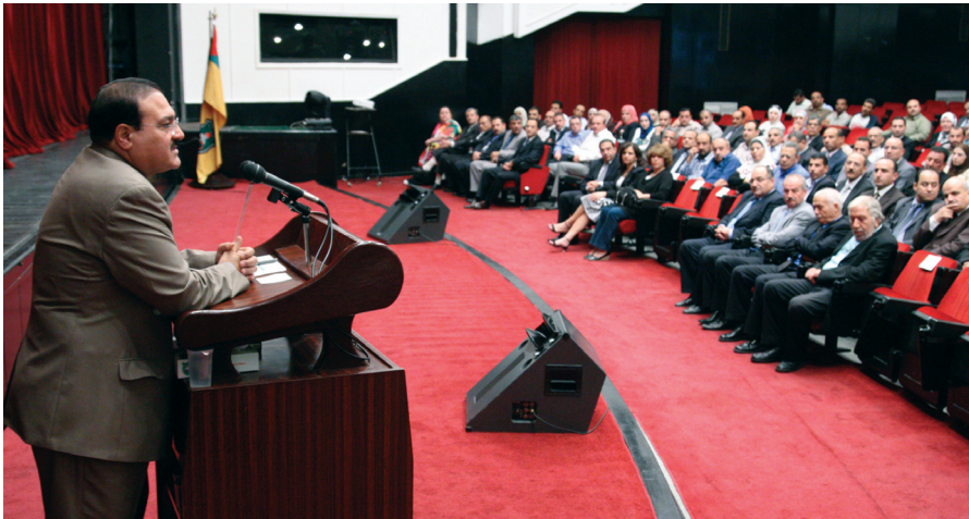
الرئيس الطويسي متحدثاً لأسرة الجامعة

مهماً من روافد العملية التدريسية في كليات ومعاهد الجامعة العلمية. وقدم أعضاء الهيئتين الإدارية والتدريسية التهنئة لرئيس الجامعة بمناسبة صدور الإرادة الملكية السامية بتعيينه رئيساً للجامعة معربين عن أملهم في أن تواصل الجامعة تحقيق إنجازاتها لخدمة الوطن العزيز وأبنائه.