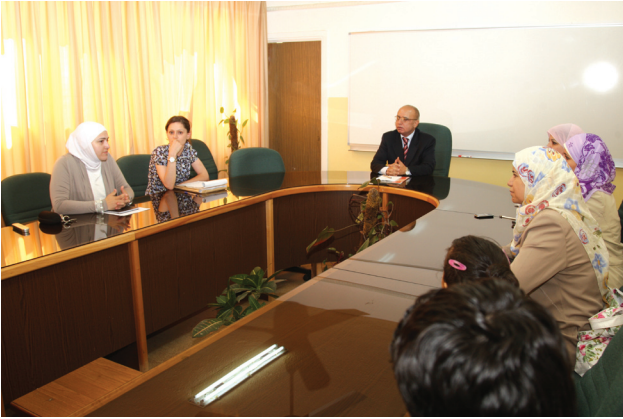
جانب من الدورة

الجامعة- أنهت معلمات فائزات بجائزة الملكة رانيا العبد الله للمعلم المتميز أعمال دورة اللغة الإنجليزية في كلية اللغات الأجنبية بالجامعة في الخامس عشر من آب الماضي. ويأتي انعقاد الدورة بحسب عميد الكلية انسجاماً مع توجهات الجامعة لدعم جهود الجائزة التي ترمي إلى إعداد معلمين متميزين قادرين على حمل لواء التعليم في الوطن العزيز. وأشار إلى أن الجائزة تفتح المجال أمام المعلمين لتوظيف إمكاناتهم وقدراتهم للنهوض بقطاع التعليم الذي يحظى باهتمام ملكي يدعم المسيرة العلمية.